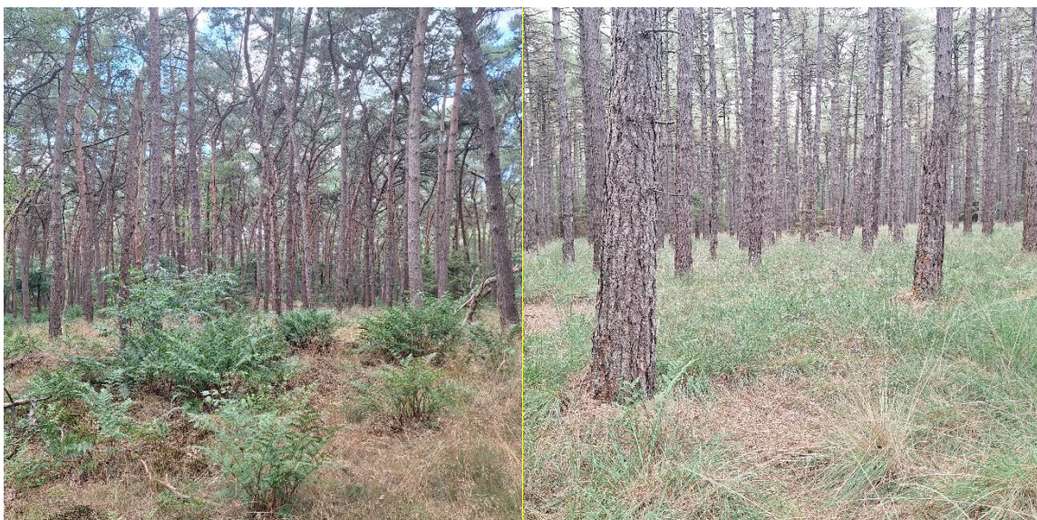
Figuur 1 Leenderbos